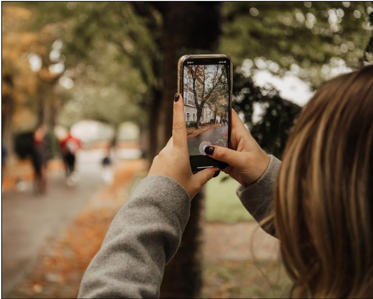
Een individuele opdracht, met eigen camera of mobieltje